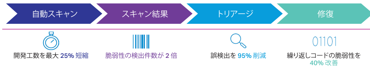
図 1 Fortify on Demand の実証済みの利点 3